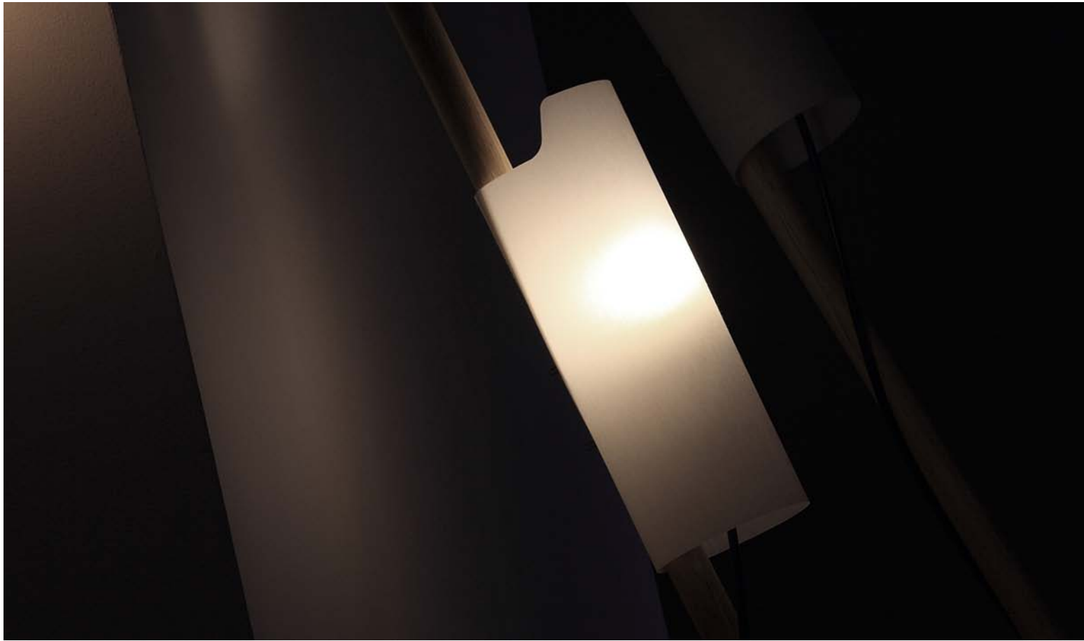
La Main Baladeuse pour ÉSÉ par Julien Michel