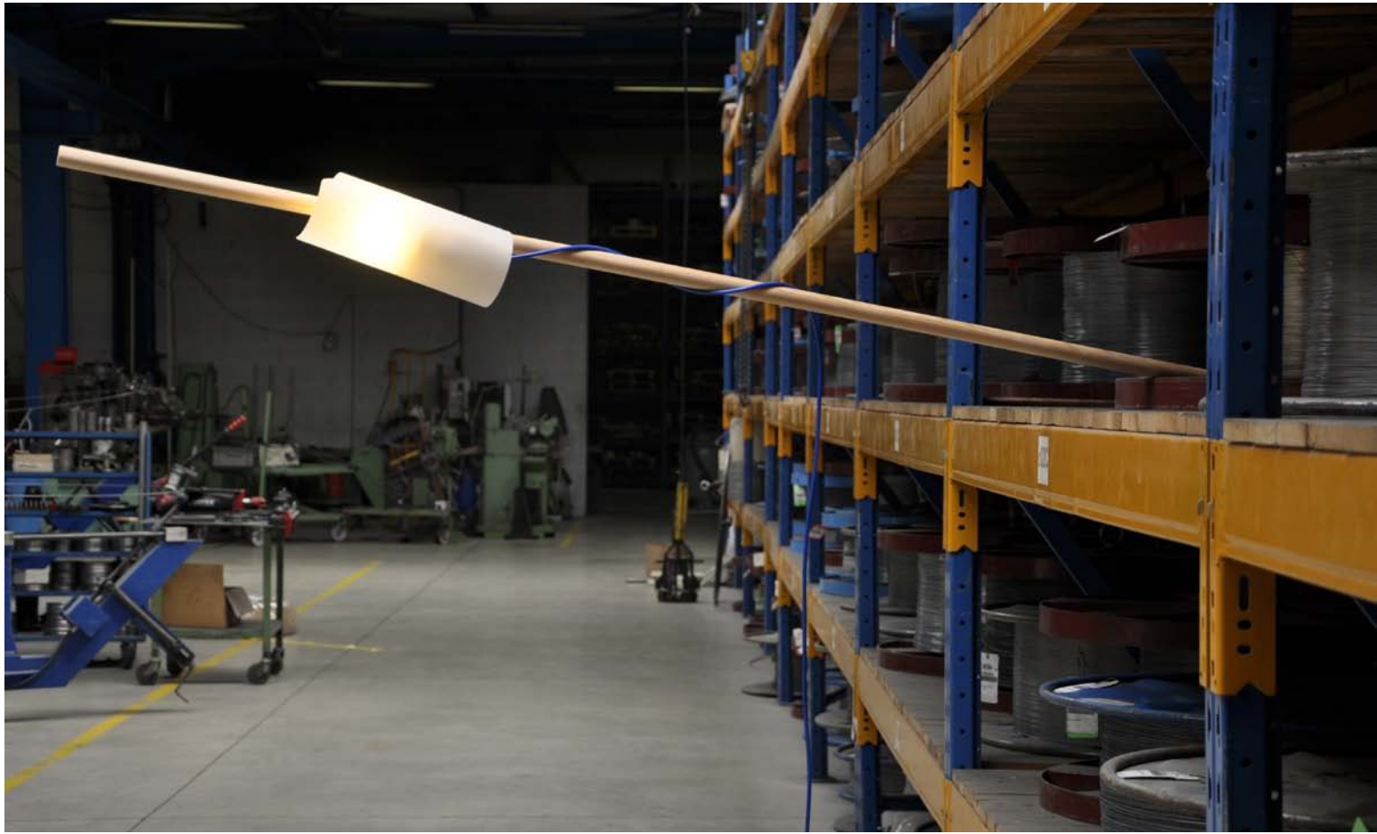
La Main Baladeuse by Julien Michel