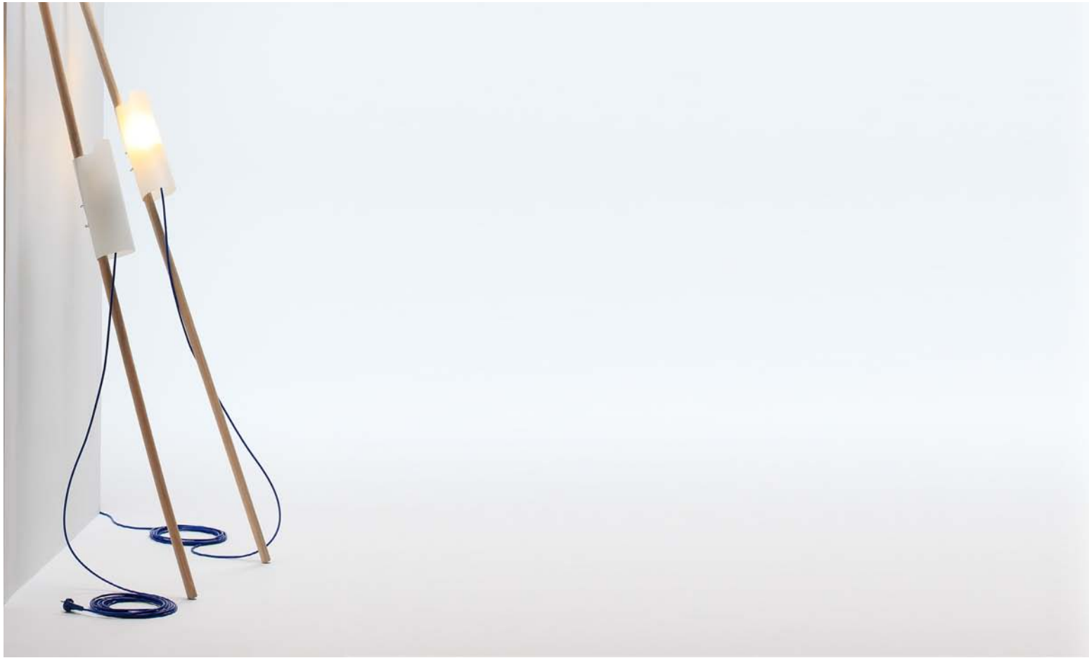
La Main Baladeuse