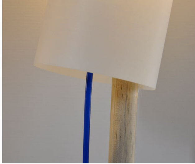
Fil inédit ÉSÉ- RAL 5005